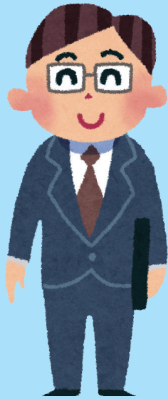
しゃかいじん 社会人