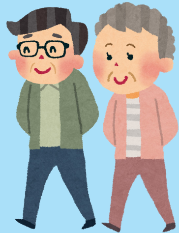
ていねん ろうご 定年・老後