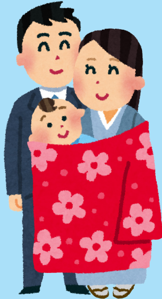
けっこん しゅっさん 結婚・出産