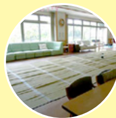
福祉避難所として、地域で 特別に支援を必要とする人々を 守ります