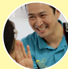
被災地で活動する支援スタッフ